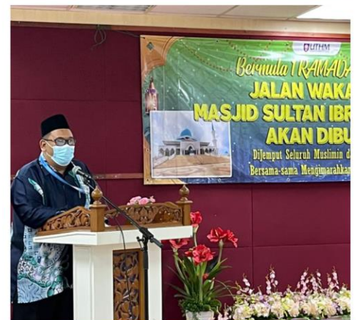
Majlis Pembukaan Jalan Wakaf Dari Taman Universiti Ke Masjid Sultan Ibrahim UTHM