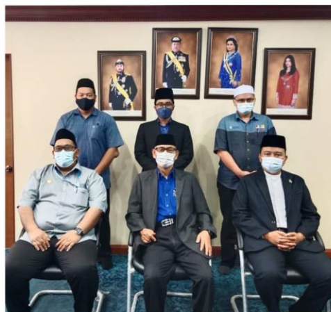
Kunjungan Hormat Ke Pejabat Penasihat MAINJ