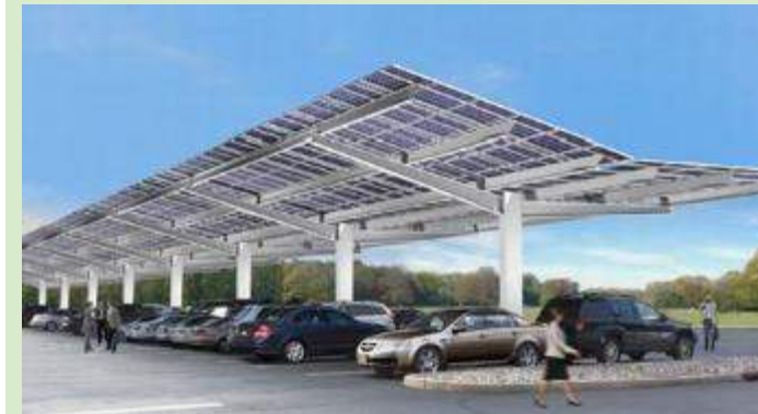
03 WAKAF PRASARANA – FASA 2