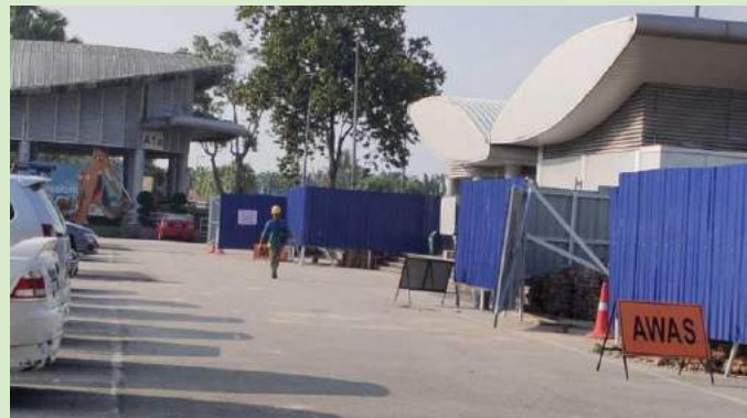
02 KIOSK PERNIAGAAN WAKAF